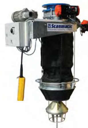
Utlastare komplett med styrning och ventiler